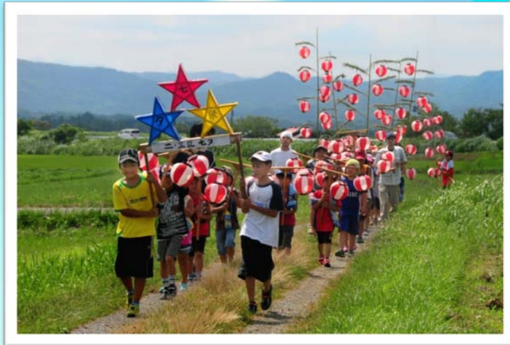
中山間地写真コンクール2012 受賞作品 作品名：「金津の七夕」 撮影場所：角田市金津地区